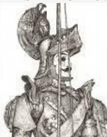
Associazione Culturale ARTE PUPÌ F.LLI NAPOLI Catania