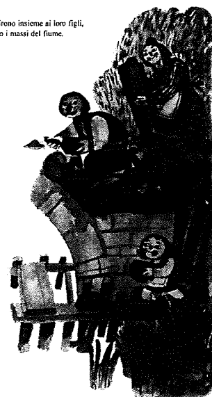
Lo costruirono insieme ai loro figli, utilizzando i massi del fiume.

Il ponte dei bambini è un percorso di 7/8 anni che ha inizio con i bambini della 1 ^ /2 ^ elementare e il suo termine con la 3 ^ media.